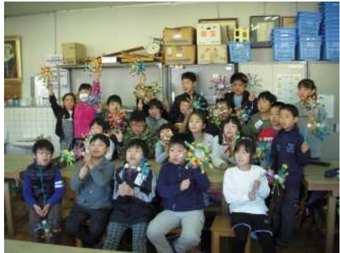
ペットボトルの切り方 ↑完成記念にパチリ